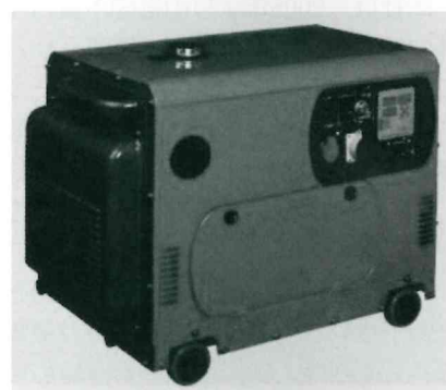
セベックバイオディーゼル発電機

セベックは、BDF製造装置の販売を進める一方、BDFを普及させるうえでの根本的な課題にBDF自体の性状があると指摘する。自治体の排ガス規制に対応したエンジンや排ガス浄化装置装着がディーゼル車に義務づけられ、従来よりエンジン構造が複雑化した。こうしたエンジンでBDFを燃やすと、軽油の引火点が90℃なのに対してBDFは180℃程度で、BDFが不完全燃焼を起こしエンジンが不具合を起こすことがある。また、既存の化石燃料を使用していたエンジンで半年に1度オイルを交換していたものがBDFの使用で月1度のペースとなるなど、メンテナンス費用も大きくなる。「環境対策でメンテナンスを続け